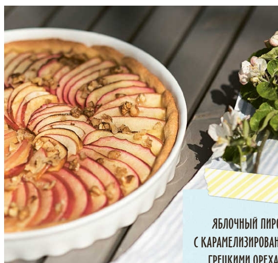
ЯБЛОЧНЫЙ ПИРОГ С КАРАМЕЛИЗОВАННЫМИ ГРЕЦКИМИ ОРЕХАМИ Рецепт на с. 193