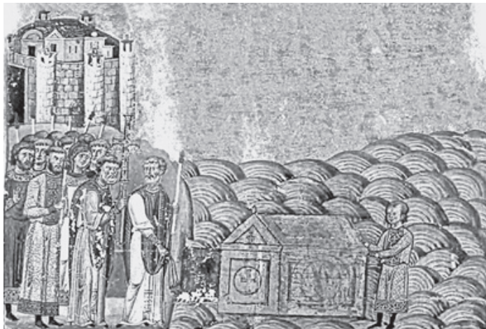
Обретение мощей святого Климента, Папы Римского. Византийская миниатюра XI века

По прошествии этого времени в Херсонес прибыли святые подвижники братья Константин и Мефодий, создатели славянской азбуки. Услышав от местных жителей, что старики еще помнят, как лицезрели мощи святого, а их дети