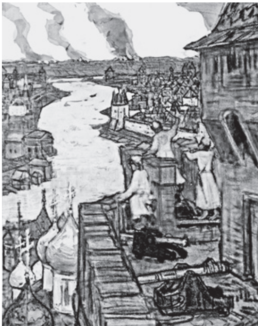
Васнецов А. М. Татары идут. Конец XIV века (Идут! Набег татар на Москву). 1909

до двух сажен, а переулков — от трех до одной. Варварка стала уже, но не менее оживленной. Особенно бойкими были Варварские крестцы — перекрестки улицы с выходящими на нее с двух сторон переулками.