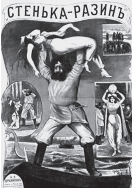
Афиша фильма «Степика Рязин и княжна». 1908

как рыбу сетью. Рязин же, развернув свои корабли, пустил ко дну флагманский корабль противника. Тот потянул за собой остальные, и бой был выигран.