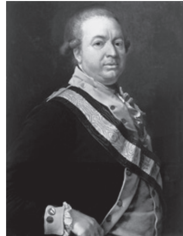
Левицкий Д. Г. Яков Александрович Брюс. 1780–1890-е

В XVII веке Гостиный двор предназначался исключительно для оптовой торговли, о чем особо указывалось в Уложении 1649 года: «Врозь никаких товаров на гостиных дворах не продавать». К концу XVII века в Гостином дворе было семьдесят два ряда — пушной, свечной, медовый и т. д. Кроме того, там была открыта первая общедоступная аптека. В 1673 году был издан особый указ, разрешающий «продавать из нее спирты, водки и всякие лекарства всяких чинов людям».