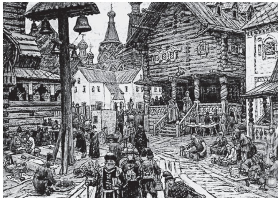
Васнецов А. М. На крестце в Китай-городе. 1902

За века своего существования Варварке довелось быть свидетельницей многих драматических событий истории. В Смутное время поляки, захватившие Китай-город, с Варварской башни обстреливали ополченцев Кузьмы Минина и Дмитрия Пожарского; через Варварские ворота увозили из Москвы тело убитого в Кремле Самозванца — Лжедмитрия I; по Варварке