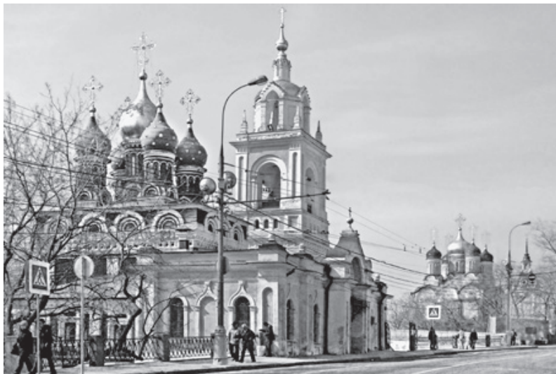
Улица Варварка. Современная фотография

Нашел свое место на Варварке и Английский двор. Пожалованный купцам-англичанам Иваном Грозным, он стал первым иностранным торговым представителем в Москве. Не чуждо было улице и просвещение: в начале XVIII века у Варварских ворот разместилась основанная Петром I школа для солдатских детей, а на протяжении XIX века в Ипатьевском переулке находилось 1-е Московское городское училище.