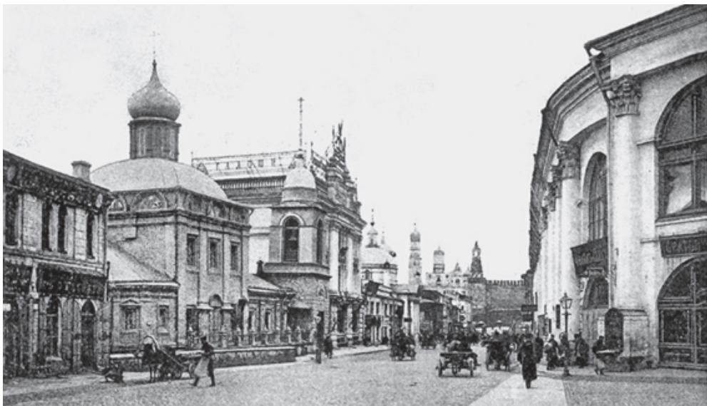
Улица Варварка. Открытка начала XX века

Свое нынешнее название Варварка получила не ранее XV века, во всяком случае, впервые оно упоминается в 1434 году в сообщении о похоронах почтенного московского юродивого Максима Блаженного, погребенного при храме Бориса и Глеба «на Варварской улице, что за Торгом». А до этого улица называлась Всехсвятской по храму Всех Святых на Кулишках, находящемуся на современной Славянской площади. В те времена площади еще не было, и ее правая сторона была продолжением улицы. Именно по ней возвращались с Куликова поля победные полки Дмитрия Донского, и по преданию храм был возведен в память русских воинов, погибших в Куликовской битве. Его освятили во имя