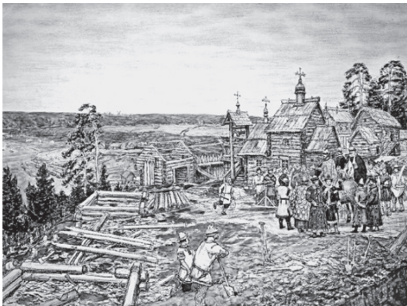
Васнецов А. М. Основание Москвы. Постройка первых стен Кремля Юрием Долгоруким в 1156 году. 1917

Всех Святых, чтобы почтить небесных покровителей всех героев, известных и неизвестных, сложивших свои головы на Куликовом поле.