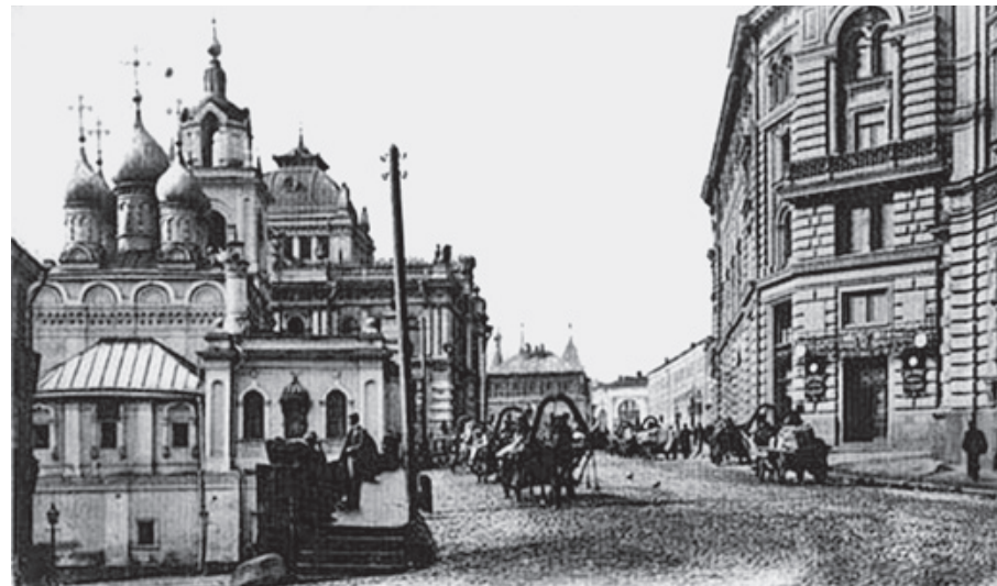
Улица Варварка. Открытка начала XX века

Не менее разнообразными были и жители Варварки. На протяжении многовекового существования улицы среди ее обитателей встречались представители решительно всех городских сословий — от знатнейших бояр, состоявших в родстве с царской семьей, до мелких канцелярских служащих; от богатейших купцов и промышленников, ворочавших миллионами, до нищих и воров. На Варварке родился государь Михаил Федорович, первый царь из династии Романовых; на Варварке прожил всю свою жизнь знаменитый художник-иконописец, реформатор русской живописи Симон Ушаков;