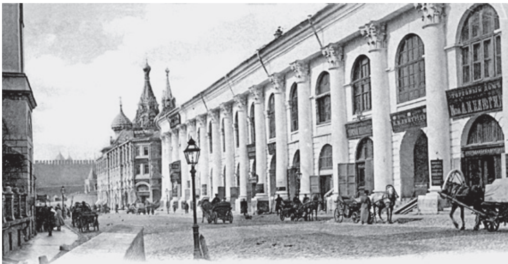
Старый Гостиный двор. Конец XIX в.

Очень ярко и выразительно описал Гостиный двор середины XIX века известный бытописатель Москвы Иван Тимофеевич Кокорев: «Занимается заря, алеет на небе... Перекликаются колокола сорока сороков церковью Белокаменной... Мы у Гостиного двора. С небольшим за час тому, запертый со всех сторон, как сундук с золотом, безмолвный и безлюдный, он вдруг растворился тысячами лавок, закипел жизнью и движением, населился и заторговал. Здесь самая многозначительная деятельность столицы; здесь вечная ярмарка; сюда стекается по крайней мере половина материалов и изделий, идущих в Москву из всех губерний, не говоря уже о местном производстве, — и отсюда расходятся они по всей России. Посмотрите, какие длинные ряды обозов тянутся сюда и отсюда... А откуда они, куда направляются? Спросите и услышите имена почти всех городов русских... Здесь разгружается один обоз, там складывается кладь на другой... Много суетливости, беготни, немало и шума, но все идет правильно, как заведенные часы, всякая вещь знает свое место. Загляните потом в эти длинные, извилистые, полутемные ряды, в которых, кажется, можно сбиться с толку без плана или руководителя, ряды, заключающие в себе склад товаров на многие миллионы рублей, но едва обозначенные