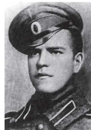
Георгий Жуков. Фотография 1916