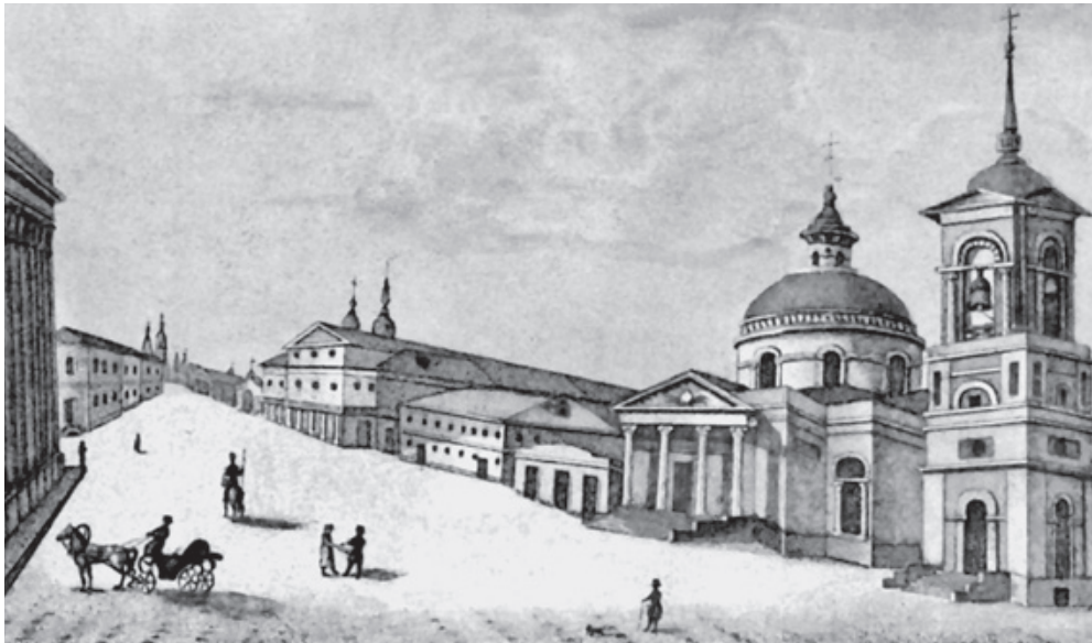
Афанасьев А. Вид Варварской улицы и части Гостинного двора (слева). 1825

Двор был обнесен кирпичной стеной, внутрь вели четверо ворот, главные из которых — красные — были украшены восьмиугольной шатровой башней, а на ее вершине был установлен медный позолоченный орел весом в 20 пудов, в знак того, что московская торговля находится под царским покровительством. Гостиный двор представлял собой живописное зрелище, его украшали яркие изразцы и многоцветные росписи, так что он по праву считался самым крупным и великолепным зданием в городе.