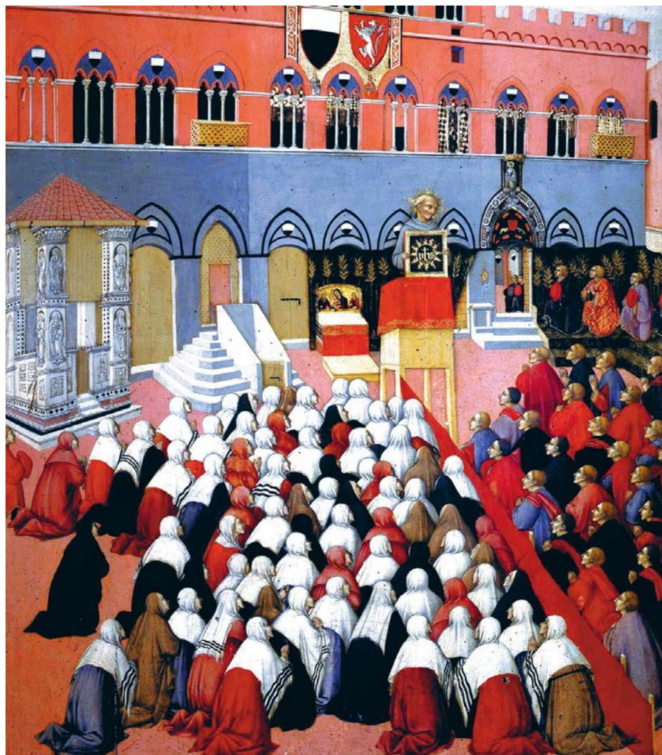
Сано ди Пьетро. Бернардино Сиенский проповедует на площади Кампо. Деталь. 1445 г.