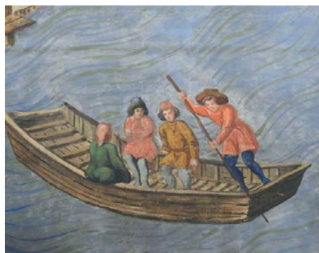
Лодочник, перевозящий молодых щеголей. Деталь «Вида Флоренции, или Carta della Catena»