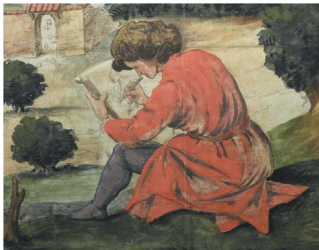
Молодой художник. Деталь «Вида Флоренции, или Carta della Catena»