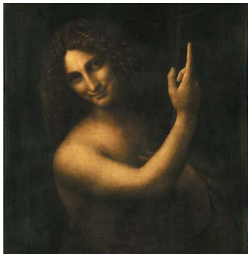
Леонардо Да Винчи. Иоанн Креститель. 1513 г.