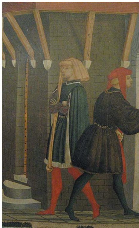
Флорентийские щеголи. Деталь росписи свадебного сундука. 1460-е гг.

стью в любом поступке» (Вазари — мастер формулировок). Но главной его юношеской добродетелью, привлечшей молодых львов, была аристократическая утонченная красота, счастливо совпавшая с флорентийскими представлениями о прекрасном эпохи Кватроченто.