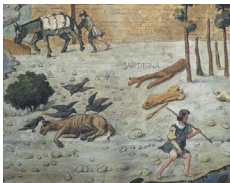
Мул и падшая кляча. Деталь «Вида Флоренции, или Carta della Catena»