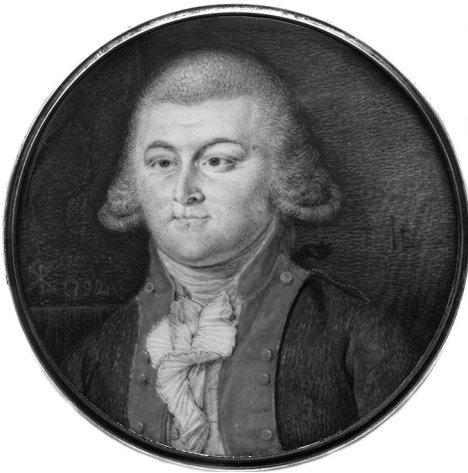
Ил. 1. Портрет неизвестного офицера армейской пехоты (1792) — гипотетический портрет Ф. В. Каржавина

единственной аргументированной и продолжает вызывать споры, поскольку есть с чем спорить 1 .