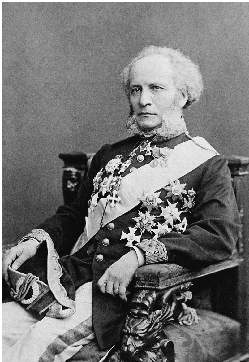
Петр Петрович Семенов-Тянь-Шанский