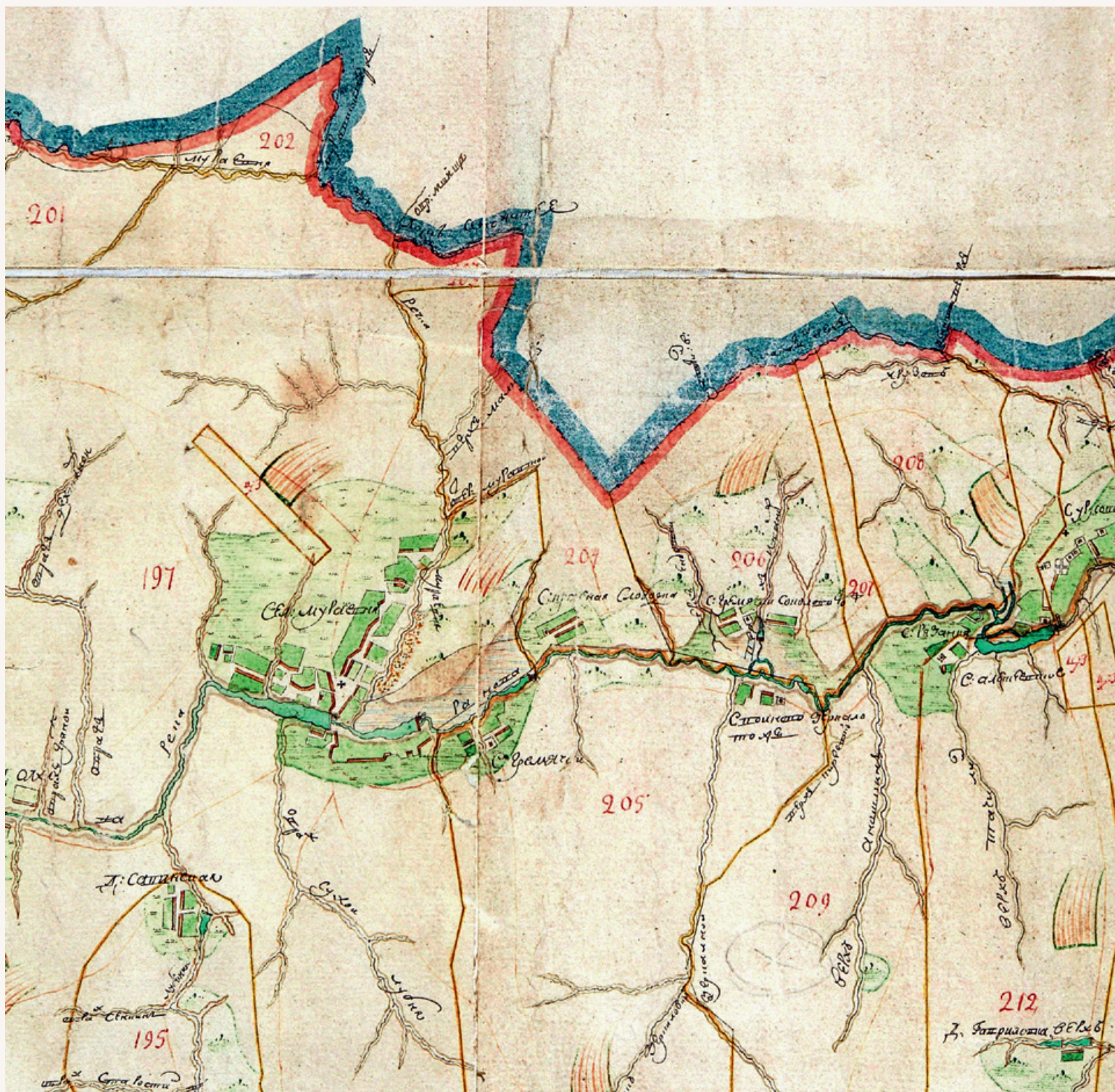
Окрестности селца Урусово. Фрагмент одноверстового Генерального плана Данковского уезда Рязанской губернии. 1790 г.