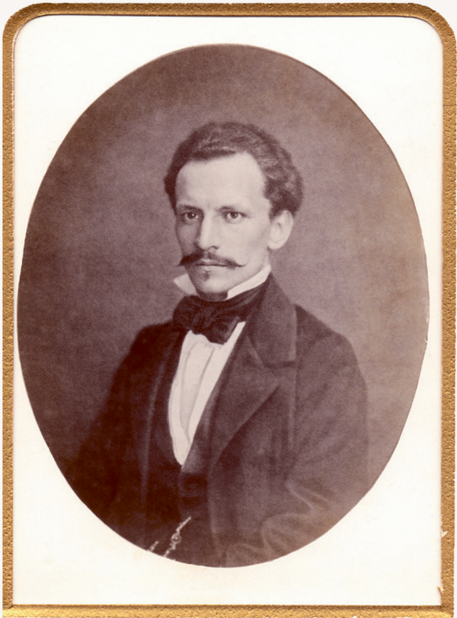
Петр Петрович Семенов. Берлин, 1854 г.