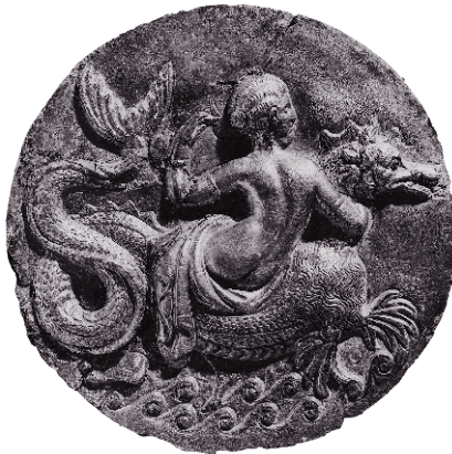
Нереида верхом на ketos (морском чудище)

Итак, прежде всего необходимо забыть о «сверхъестественном». Однако, чтобы понять, что такое магия древности, нам придется еще много чего выбросить из головы. В нашем мире — особенно на Западе — религия уже давно присвоила исключительное право на взаимодействие с невидимыми силами и субстанциями. В древности такой монополии не существовало. Религиозный институт спонсировался государством, а вера воспринималась как гражданский долг каждого человека; задача религии состояла в том, чтобы поддерживать мир