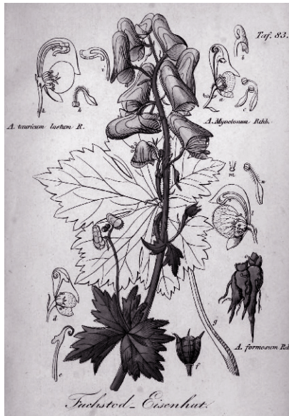
Аконит, или волчий корень. Он убивает не только волков...

между людьми и богами. Мифология же очеловечивала богов и объясняла, как возникла Вселенная и как она устроена. А кроме того, была еще магия, которой пользовались самые обычные люди, чтобы напрямую взаимодействовать с незримыми силами.