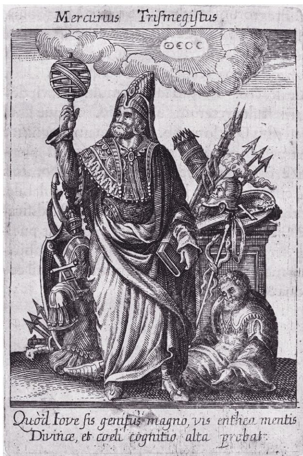
Меркурий (Гермес) Трисмегист, «рожденный великим Юпитером, одаренный силой божественного разума, ведающий тайны небес»