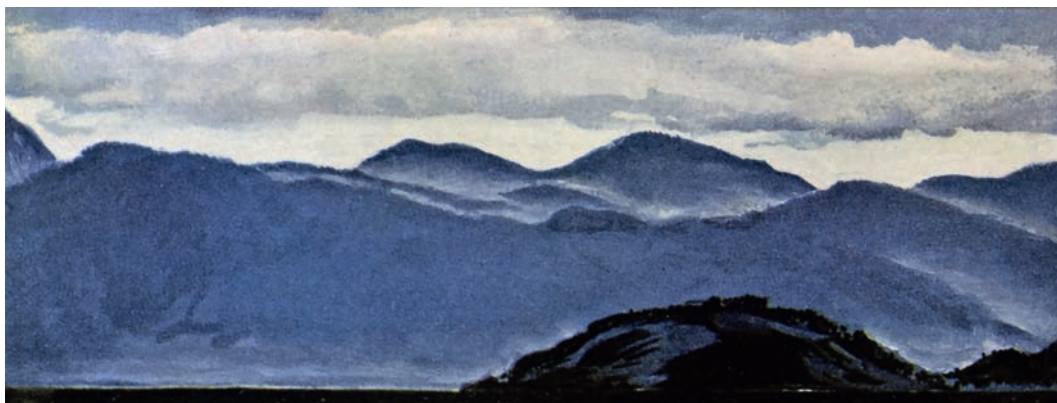
Силуэт гор от аула Махкеты в сторону крепости Воздвиженской 1913 Издание 1916 г.

Еще в молодости Евгений Евгеньевич увлекся творчеством Л. Н. Толстого, отмечал меткость его наблюдений