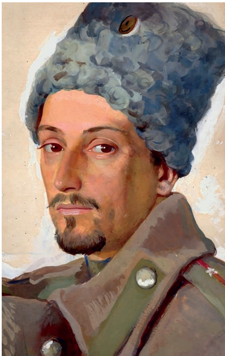
Портрет Е. Е. Лансере в папахе