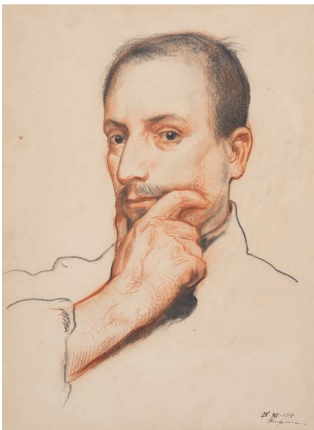
Автопортрет Тифлис, 1914 Государственный музей-заповедник «Петергоф»