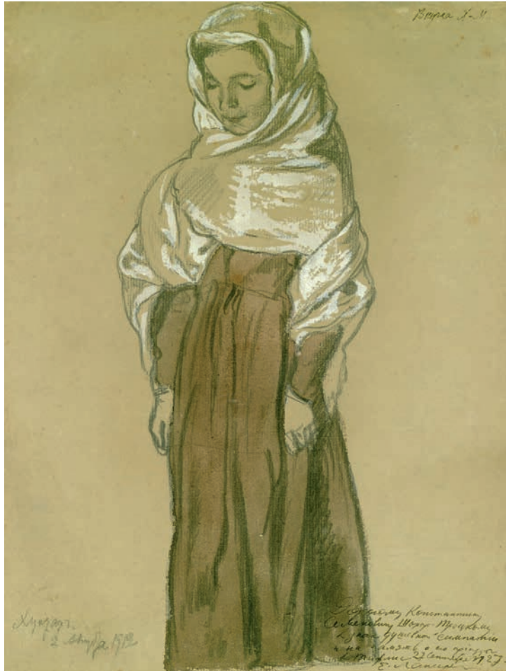
Умма, внучка Хаджи-Мурата Хунзах, 2 августа 1912