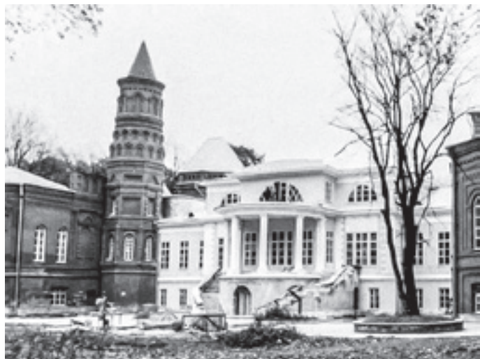
Восстановление главного дома. Фотография середины 1990-х. Восстановлен внешний вид дворца, каким он был при Елизавете Петровне Глебовой-Стрешневой

водителям. Так, был воссоздан в северо-восточном углу старой части здания большой кабинет, разделенный прежде на три клетушки и коридор. При этом театральный флигель в свою очередь был радикально перепланирован новыми безвкусными гипсокартонными перегородками.