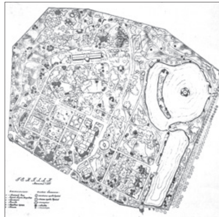
Эскизный план обустройства усадебной территории.

Если попытаться представить себе все эти новшества в существующих помещениях дворца, совершенно не приспособленных для такого использования конструктивно и архитектурно, то просто берет оторопь. Судя по архивным материалам, многие помещения проектировщиками вписывались в существовавшую планировку без какой-либо системы, однотипные помещения могли располагаться в разных этажах и, более того, в разных частях здания. Так, две пары залов — приемов и банкетных — располагались бы на одном этаже, а один — на другом, причем в другой части здания, а гостиничные номера буквально впихивались бы в не предназначенную для этого планировку в театральном флигеле. В связи с этим становится понятным настойчивое стремление заказчика перестроить деревянную часть дома в кирпиче — так и практичней, и охранные требования не столь строгие, —