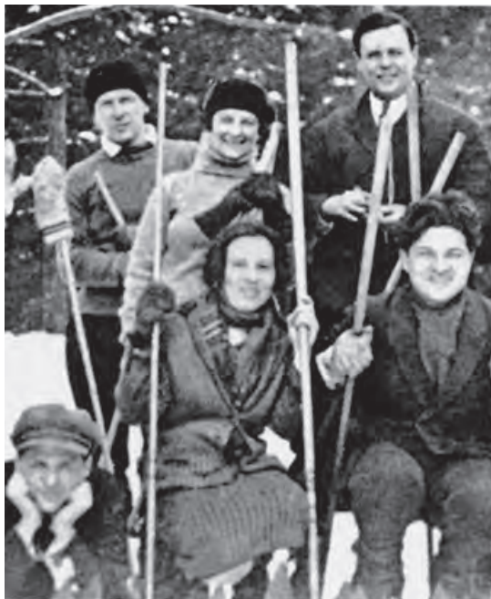
М. А. Булгаков и Л. Е. Белозерская (стоят слева) на лыжной прогулке с мхатовцами. Фото 1928

(Л. Е. Белозерская-Булгакова. Воспоминания)