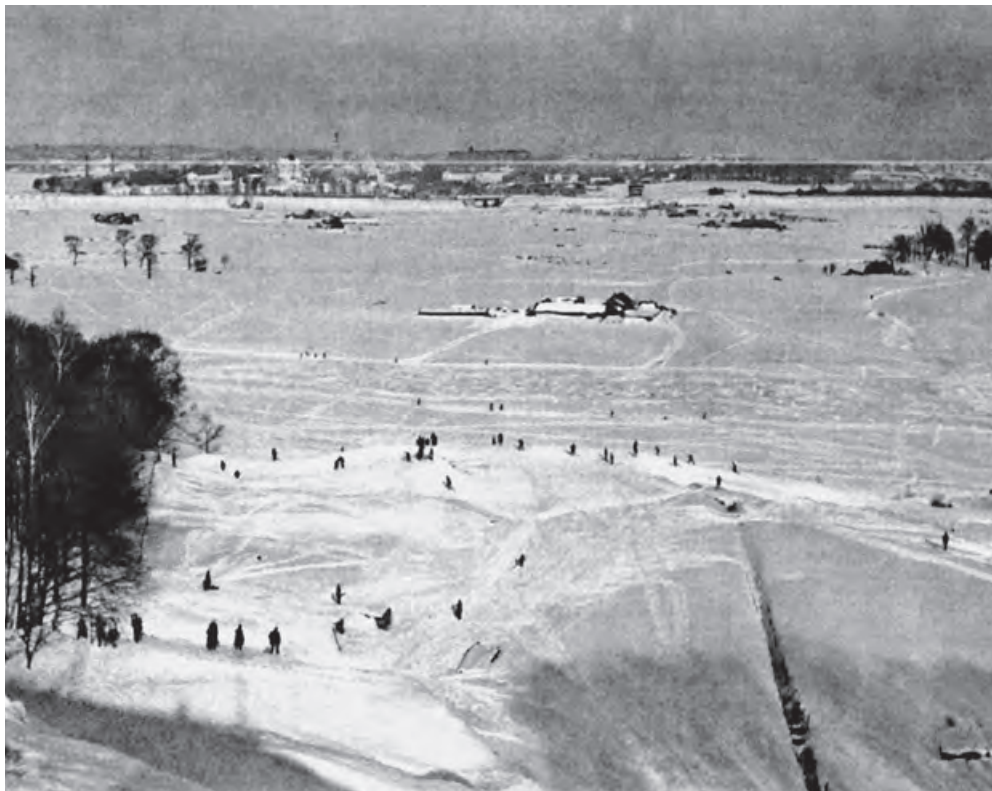
Вид с Воробьевых гор. Фото середины 1920-х

Остоженка была перекопана, начинали строить первую очередь метро (его строили открытым способом). Через улицу в некоторых местах были перекинуты