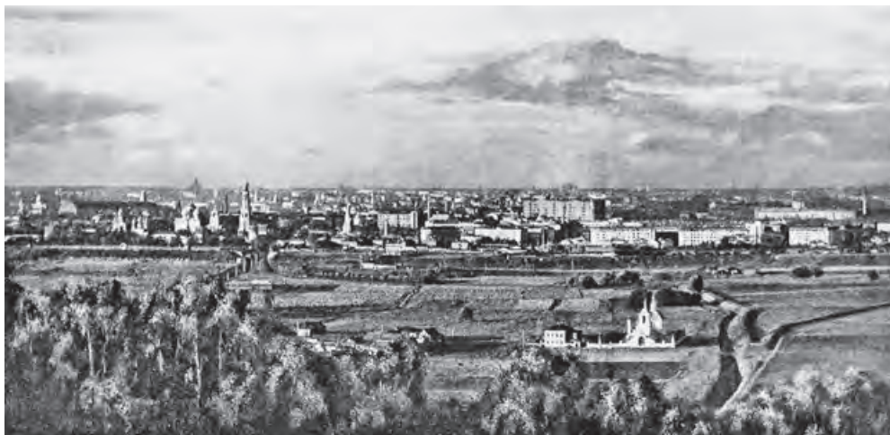
Вид на Москву с Воробьевых гор. Фото конца 1920-х

Грозу унесло без следа, и, аркой перекинувшись через всю Москву, стояла в небе разноцветная радуга, пила воду из Москвы-реки.