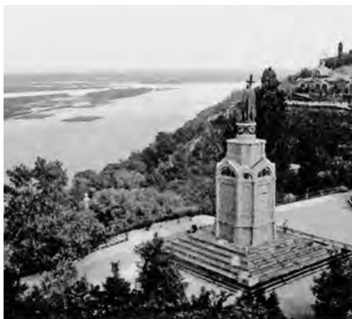
Владимирская горка в Киеве.