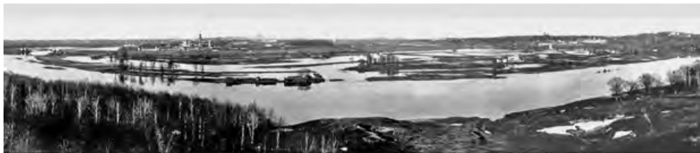
Вид с Воробьевых гор. Фото 1908

В произведениях Булгакова одна из памятных картин — безгранично просторная панорама, открывающаяся с обрывистого берега реки, словно с птичьего полета.