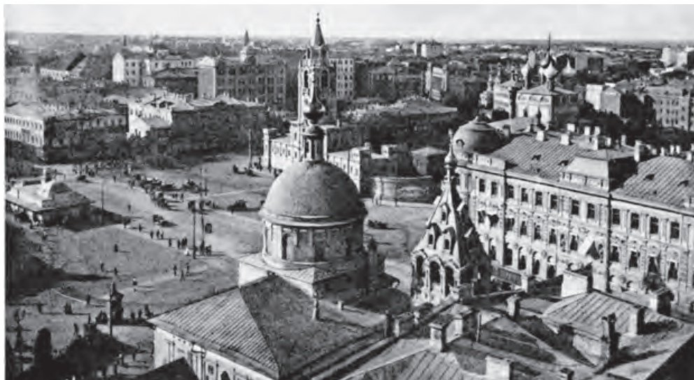
Страстная площадь, вид с крыши дома Нирнзее. Фото середины 1910-х

А вид перед героем открывается примерно такой.