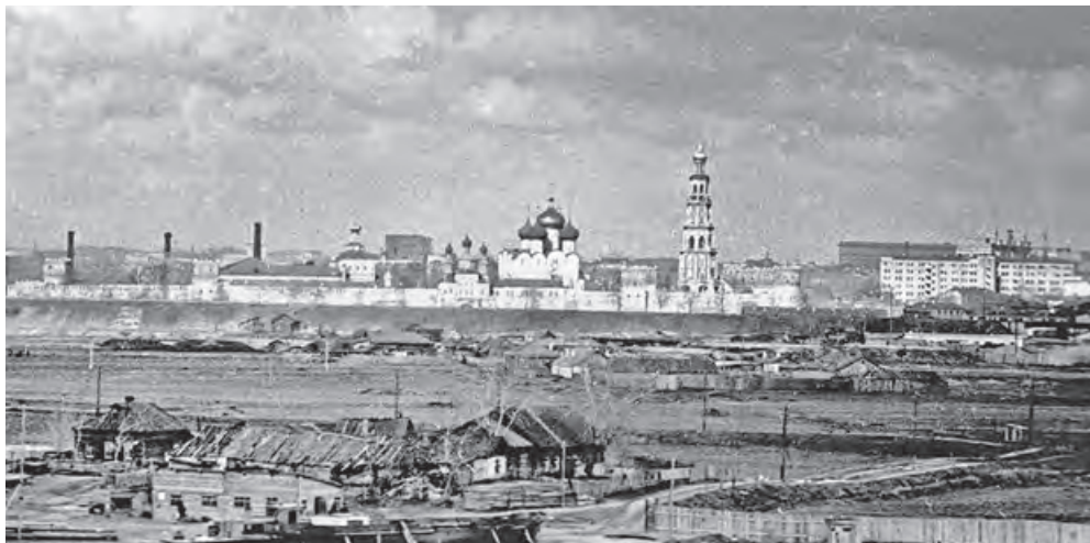
Вид с Ленинских (Воробьевых) гор. Фото середины 1930-х

В воздухе зашумело, и Азazelло, у которого в черном хвосте его плаща летели мастер и Маргарита, опустил вместе с ними возле группы ожидающихся.