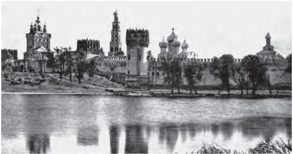
Новодевичий монастырь. Фото середины 1920-х

Между прочим, по преданию, в одном из прудов Новодевичьего монастыря лежит булгаковский револьвер.