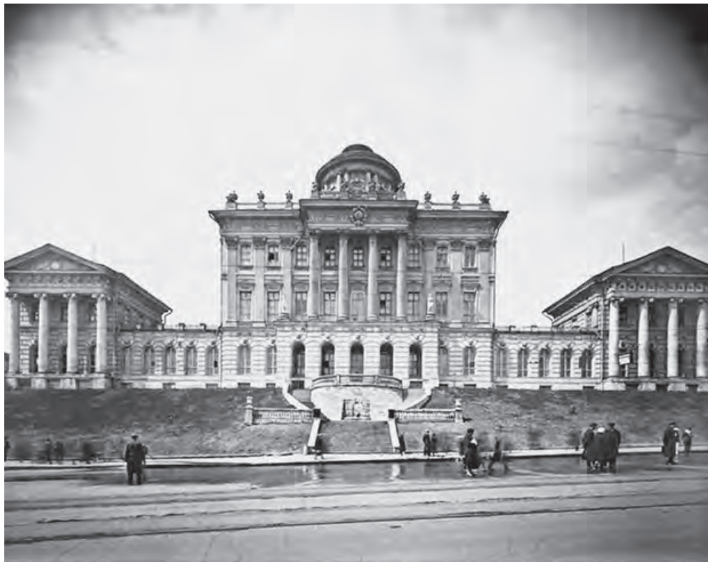
Дом Пашкова. Фото конца 1930-х