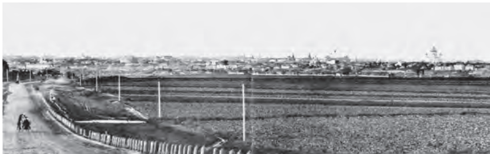
Фото примерно на сто лет позже Наполеона, но с «его» точки

На высоте, на холме, между двумя рощами виднелись три темных силуэта. Воланд, Коровьев и Бегемот сидели на черных конях в седлах, глядя на раскинувшийся за рекою город с ломаным солнцем, сверкающим в тысячах окон, обращенных на запад, на пряничные башни девичьего монастыря.