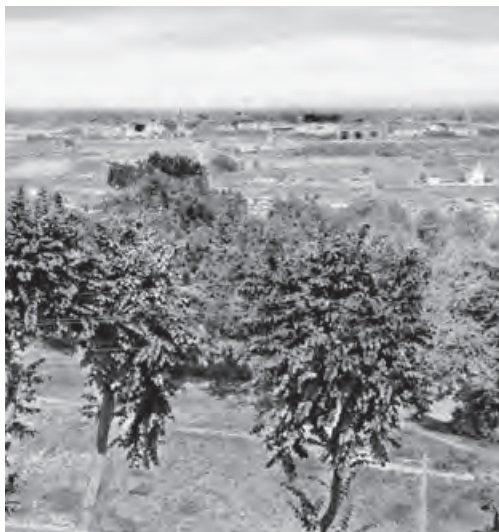
Вид с Воробьевых гор. Фото Б. Деку. 1931

...Сидя у себя в пятом этаже, в комнате, заваленной букинистскими книгами, я мечтаю, как летом взлезу на Воробьевы, туда, откуда глядел Наполеон, и посмотрю, как горят сорок сороков на семи холмах, как дышит, блестит Москва. Москва — мать.