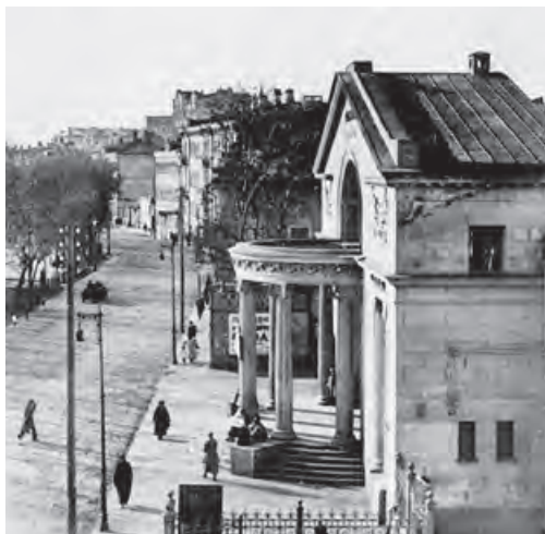
Кинотеатр «Коллизей» на Чистопрудном бульваре. Фото второй половины 1930-х

Под утро, по совершенно бессонной Москве, не потушившей ни одного огня, вверх по Тверской, сметая все встречное, что жалось в подъезды и витрины, выдавливая стекла, прошла многотысячная, стрекочущая копытами по торцам, змея конной армии. Малиновые башлыки мотались концами на серых спинах, и кончики пик кололи небо. Толпа, мечущаяся и воющая, как будто ожила сразу, увидав ломящиеся вперед, рассекающие расплеснутое варево безумия, шеренги. В толпе на тротуарах начали призывно, с надеждою, выть. <...>