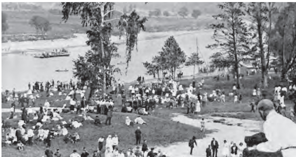
Москвичи отдыхают на Ленинских (Воробьевых) горах. 1926

(Е. С. Булгакова. Дневник 27 июня 1937 г.)