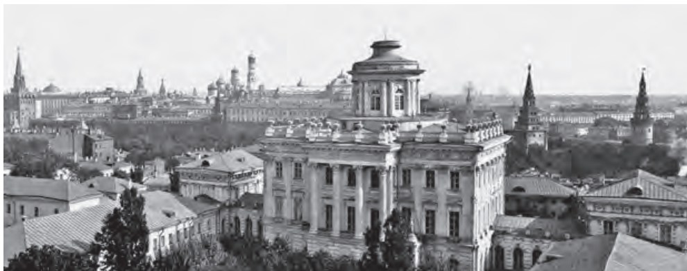
Дом Пашкова (Румянцевский музей) и вид на Кремль. Фото около 1930

И еще одна важная для писателя господствующая высота — бельведер знаменитого дома Пашкова.