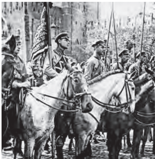
Красная кавалерия на Красной площади. 1923