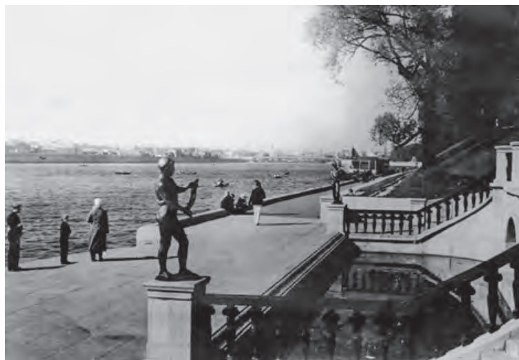
Набережная ЦПКиО. 1930-е