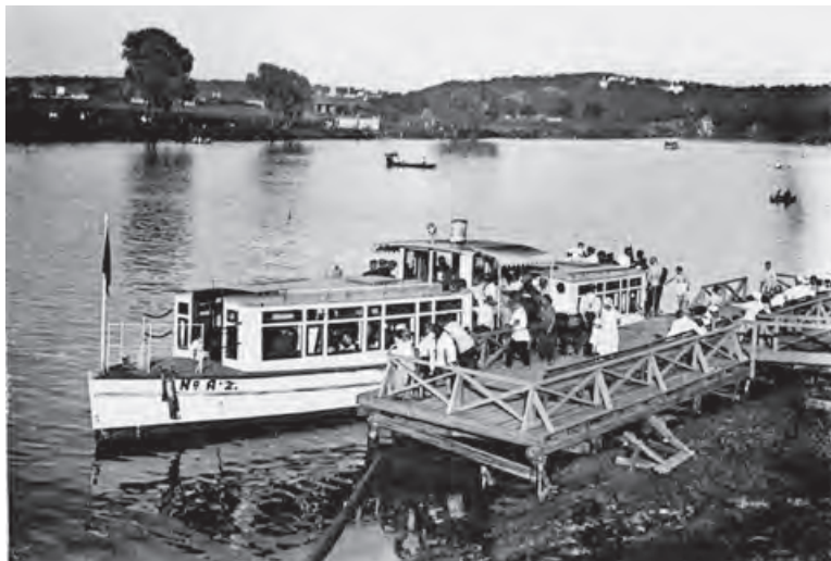
Пристань у Ленинских (Воробьевых) гор. Фото 1931