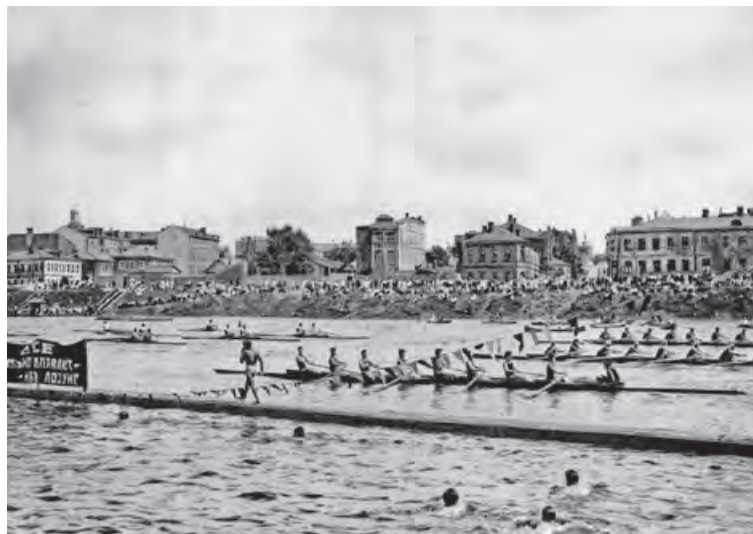
Парад байдарок на Москве-реке. Фото середины 1920-х