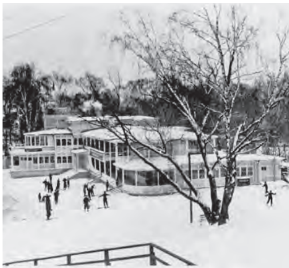
Лыжная станция на Ленинских (Воробьевых) горах. Фото 1936