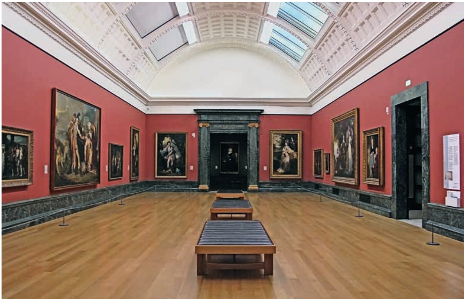
Галерея Тейт Бритен. Интерьер одного из залов галереи.

из множества ночных бомбардировок, обрушившихся на территорию Тейт в последующие месяцы. Хотя галерея была закрыта для публики во время войны, ее здание продолжали использовать: уцелевшая ресторанный зона стала местом встреч клуба для мальчиков, в подвальных помещениях находились штаб-квартира инженерного отделения Министерства труда и хранение Министерства продовольствия.