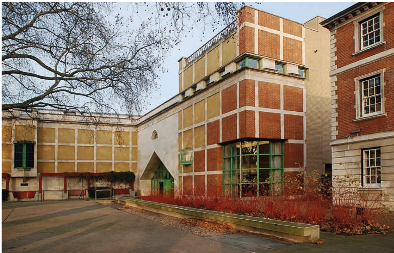
Галерея Клор. Вид с востока, со стороны Темзы.

В результате наводнения некоторые картины были повреждены и утрачены, однако удивительным образом не пострадали ни акварели Тёрнера, пролежавшие несколько часов в грязной воде, ни недавно завершённые работы Рекса Уистлера. Это наводнение стало самым разрушительным природным катаклизмом в истории галереи, но угроза затопления музея неоднократно возникала и в последующие годы. Окончательно эта проблема была решена лишь в 1979 году.