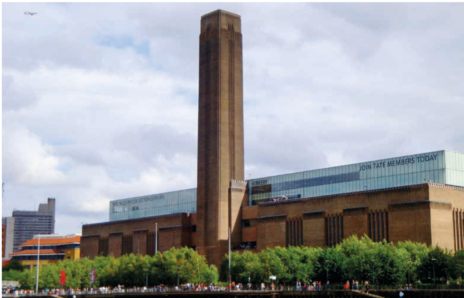
Галерея Тейт Модерн. Общий вид музейного комплекса после реконструкции электростанции.

чтобы оживить интерес к национальному искусству в первую очередь среди молодежи. Важную роль в этом сыграло привлечение молодых художников, что стало возможным благодаря учрежденной в 1984 году ежегодной Премии Тёрнера, ориентированной на наиболее радикальные тенденции актуального искусства. Кроме того, серьезная реконструкция здания, осуществленная в 2012–2013 годах известным архитектурным бюро «Карузо Сент-Джон» (Caruso St John), позволила значительно расширить и модернизировать его внутренние пространства, и сегодня здесь проходят ретроспективные выставки британских художников и проекты, посвященные современному национальному искусству, в том числе регулярные Триеннале под руководством приглашенного куратора.