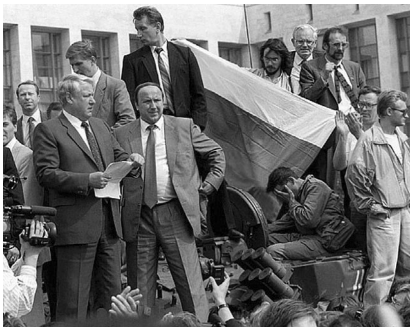
Президент России Борис Ельцин во время антигорбачевского путча в своей эмоциональной речи перед зданием правительства призывает население к всеобщей забастовке. 20 августа 1991 года

членение страны и разъединение государства <...>. Я покидаю свой пост с тревогой. Но и с надеждой, с верой в вас, в вашу мудрость и силу духа. Мы — наследники великой цивилизации, и сейчас от всех и каждого зависит, чтобы она возродилась к новой современной и достойной жизни. <...> Желаю всем вам всего самого доброго» 14 .