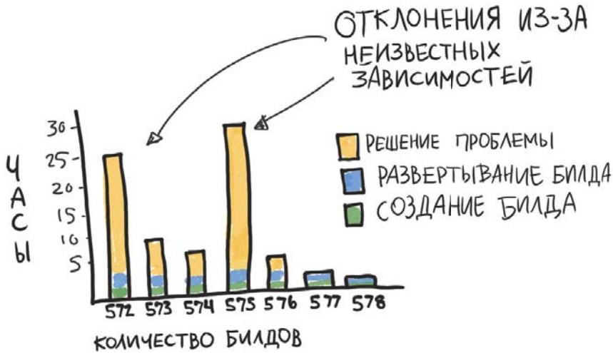
Рис. 1. Билды требуют не так уж много времени

Наша репутация ухудшилась. Разработчики жаловались, что на билды уходит слишком много времени. Это, естественно, оскорбляло меня. Я вознамерилась доказать, что они ошибаются, и записала сроки создания и развертывания билдов (рис. 1).