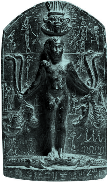
Хор-младенец, сын Осириса и Исиды

картина мира, сформировалось особое восприятие действительности; миф стал стержнем общества, сеткой культурных представлений, наложенной на карту природных явлений. Проникнутая внутренней логикой, жизнь обретала смысл; на место хаоса приходил порядок; беспомощность сменялась уверенностью; знание изгоняло невежество. Мир, с его жестокими песчаными бурями и смертельно опасными скорпионами, становился менее страшным.