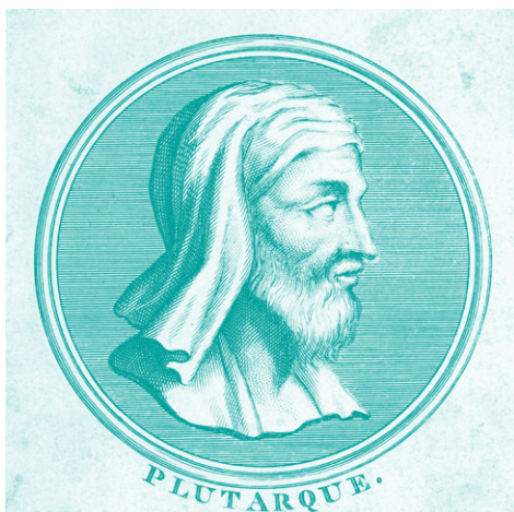
Древнегреческий историк Плутарх записал немало египетских мифов

их версии попросту не существует — досадный и отрадный факт. Досаден он потому, что адекватно отобразить систему верований египтян в одной книге не получится, однако меня радует, что не придется ограничиваться сухим пересказом. Эта книга ближе к трудам Плутарха, чем к строгим научным исследованиям. По примеру древнего историка, сложившего элементы мифа об Осирисе в единый рассказ для греков, я беру фрагменты мифов — порой из разных исторических периодов — и свожу их в единое повествование; надеюсь, мне простят такой «монтаж», как его простили Плутарху.