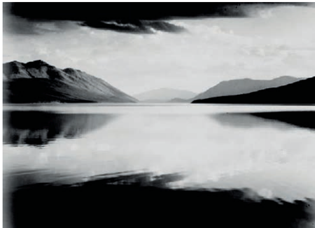
Вид на горы через озеро, «Вечер, озеро Макдональд, национальный парк Глейшер», Монтана. Ансель Адамс. 1941–1942. Национальный архив США

ОСНОВНЫЕ ИМЕНА: АЛЬФРЕД СТИГЛИЦ • ПОЛ СТРЭНД • АНСЕЛЬ АДАМС • ЭДВАРД УЭСТОН • УИЛЛАРД ВАН ДАЙК • ИМОДЖЕН КАННИНГЕМ