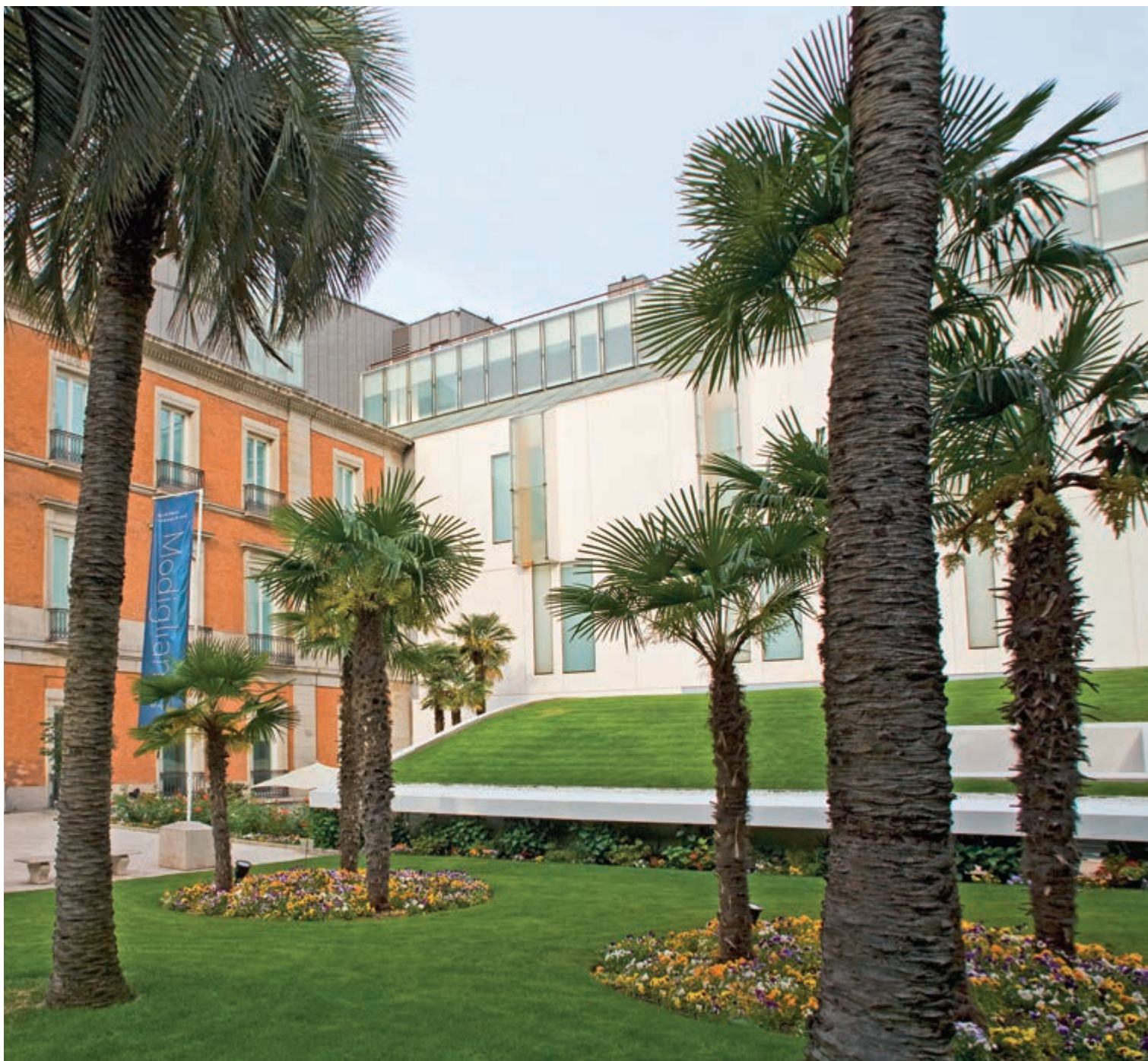
Палаццо де Вильяэрмоса и новое здание музея (справа)

Венгерская революция 1919 г. вынудила Генриха Тиссен-Борнемиса покинуть страну. Он поселился в Амстердаме, где в 1921 г. родился его сын Ганс Генрих Тиссен-Борнемиса (1921–2002).