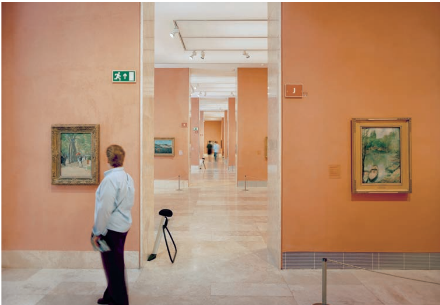
Зал с картинами XIX в. из собрания Кармен Тиссен-Борнемиса

Часть коллекции Кармен Тиссен-Борнемиса, насчитывающая 338 живописных работ, экспонируется в Музее Кармен Тиссен-Борнемиса в Малаге, открытом в марте 2011 г. Там находятся произведения испанских художников XVII в., в частности полотно Франсиско де Сурбарана Святая Марина (ок. 1650), но в основном картины испанских мастеров XIX в. (Хенаро Переса де Вильямира, Рамона Касаса-и-Карбо, Игнасио Сулоага-и-Сабалета, Мариано Фортун-и-Карбо, Эрменхильдо Англада-и-Камараса). С именем Кармен Тиссен-Борнемиса связаны не только замечательные приобретения для музея, но и некоторые потери. В частности, она продала в 2012 г. на аукционе Christy's картину Джона Констебла Шлюз , оцененную в 25 миллионов фунтов стерлингов. На фотографиях, сделанных до 2012 г., полотно Констебла Шлюз еще видно в глубине одного из залов музея.