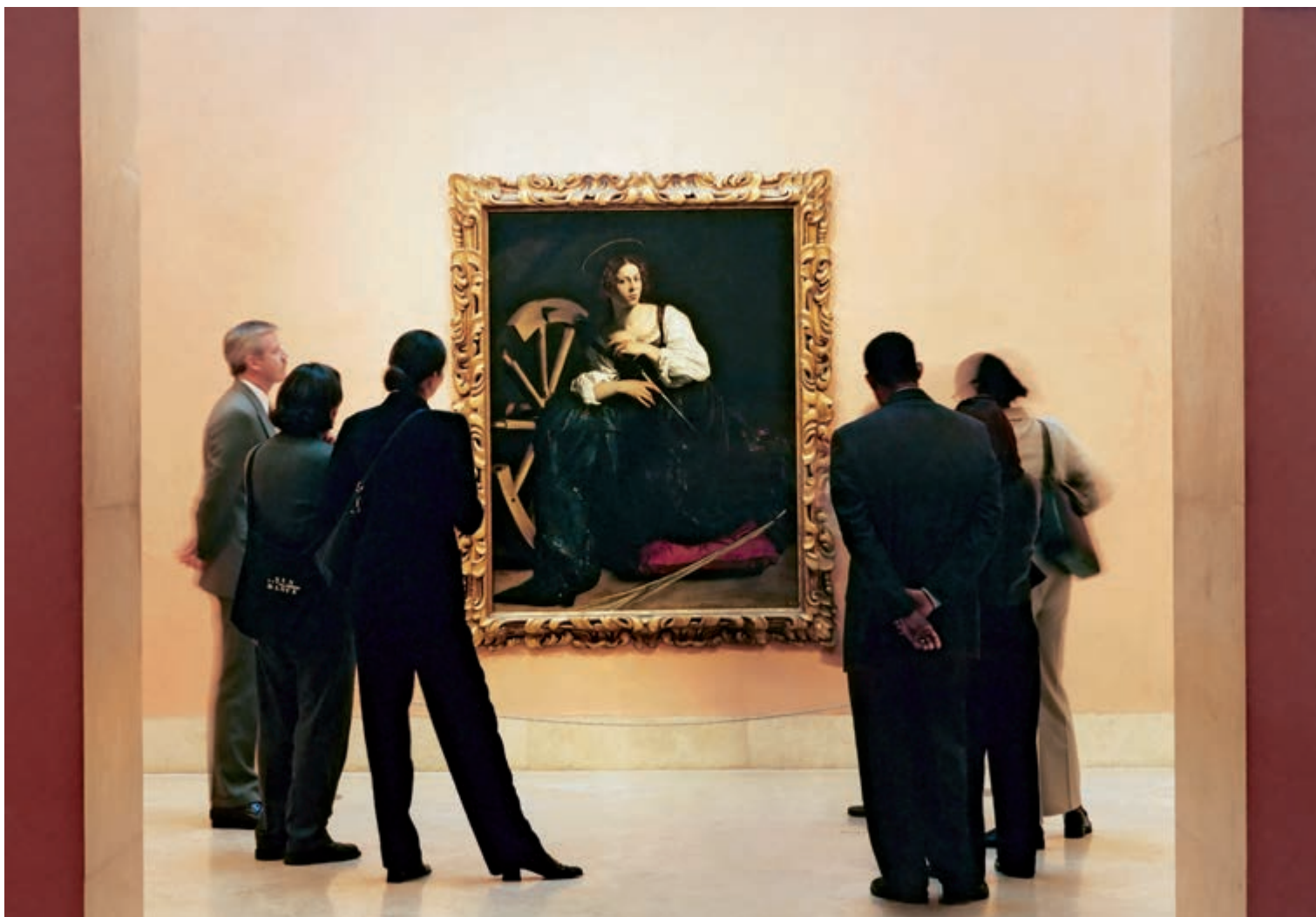
Посетители перед картиной Караваджо Святая Екатерина Александрийская

Коллекция иногда покидала виллу Фаворита и демонстрировалась во многих странах мира, в том числе и в Советском Союзе: в 1980-е гг. в ГМИИ имени А. С. Пушкина, Эрмитаже и Русском музее. В свою очередь, Эрмитаж и ГМИИ имени А. С. Пушкина устроили ответную выставку «Картины импрессионистов и постимпрессионистов из музеев Советского Союза» на вилле Фаворита в 1983 г.