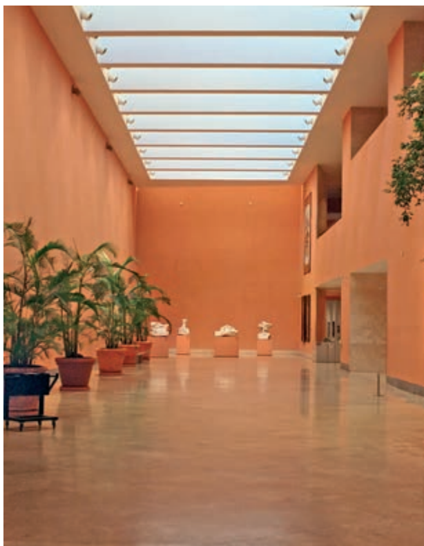
Вестибюль музея со скульптурами Родена