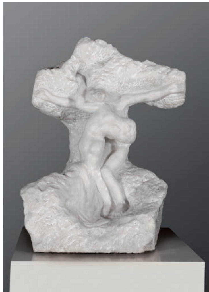
Огюст Роден, Христос и Мария Магдалина — с этой скульптуры начиналось собрание Генриха Тиссен-Борнемиса

Ганс Генрих наряду с работами старых мастеров активно собирал картины художников XIX—XX вв. Каталог галереи, находившейся на вилле Фаворита, был издан в 1981 г. и переиздан в 1986-м. Каталог 1986 г. насчитывал 335 номеров. В действительности он включал гораздо больше произведений, так как нередко под одним номером числилось несколько работ. В приложении к каталогу был опубликован список скульптур и произведений декоративно-прикладного искусства. В каталоге воспроизведено примерно 350 картин, но только те, что находились в постоянной экспозиции. Не были включены в каталог картины французских импрессионистов, немецких экспрессионистов, американских художников-абстракционистов, произведения мастеров русского авангарда, о коллекционировании которых упоминал Ганс Генрих Тиссен-Борнемиса в предисловии к изданию 1986 г. Он писал также, что в живописи отдавал предпочтение пейзажам. Согласно его подсчетам, в это время в коллекции было 1400 картин художников XII—XX вв.